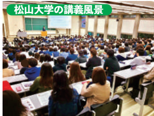
松山大学の講義風景

中堅私立大学の試験で頻出の内容を徹底的に取り扱い、合格率を上げていきます。特に、昨年度の松山大学の受講者合格率は100%！基礎が不安な人にもおすすめ。