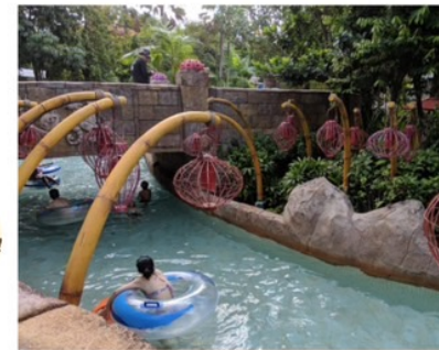
超ロング流れるプール (プールに浮かぶ浮き輪は使い放題！)