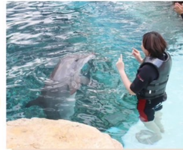
イルカと触れ合いタイム♪