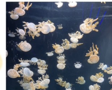
クラゲの幻想的な乱舞