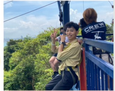
ジップライン出発直前！